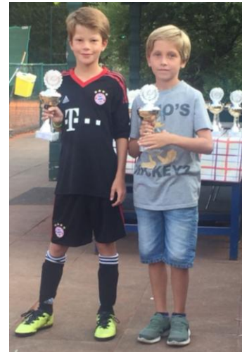
Foto der beiden Sieger