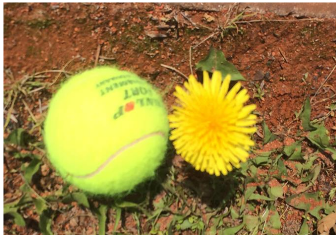
Autor und Foto Karin Tensil