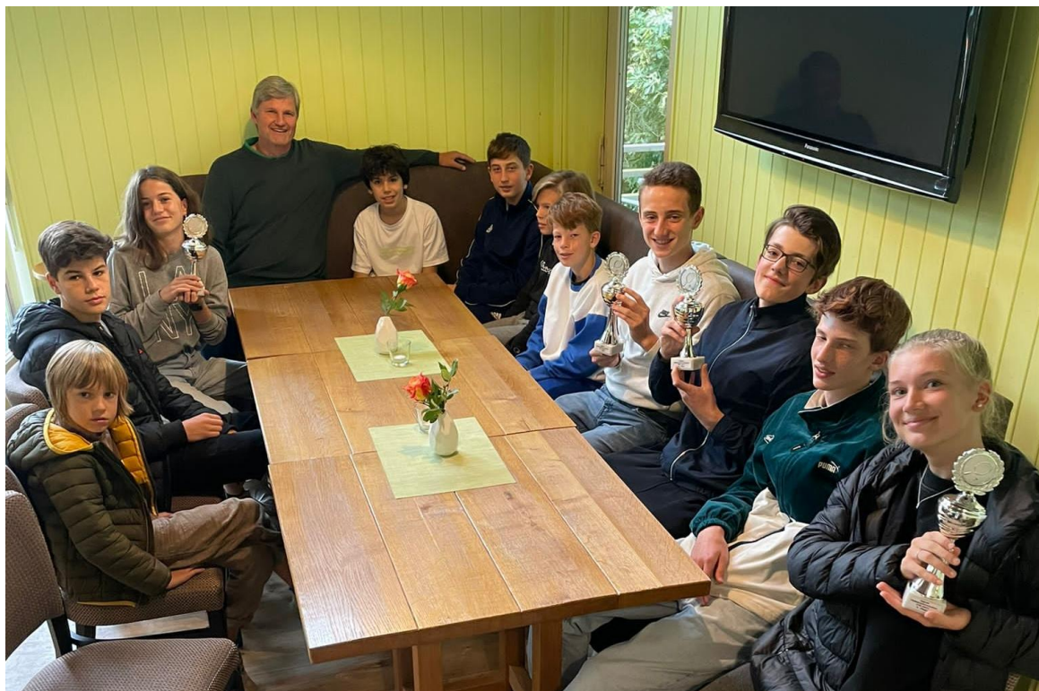
Gruppenfoto nach der Siegerehrung

Weiter so! Trainiert fleißig, dann werden sich unsere Damen- und Herrenmannschaften auf euch freuen.