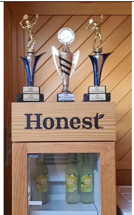
Cooler Platz für die Pokale!