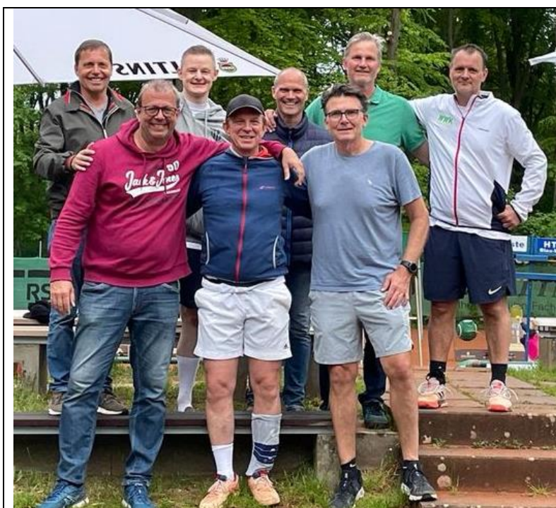
Foto zum Saisonauftakt: Die H50 freuen sich über den 1. Sieg der Saison:

Mit dem Sieg im Rücken freuen sich die H50 auf das Lokalderby gegen den PSV am nächsten Samstag 13.5. auf heimischer Anlage. Da ist vom letzten Jahr noch eine Rechnung offen, denn beim Aufeinandertreffen in der letzten Saison gingen 3 von 6 Einzeln im MTB an die starken Spieler des PSV. Das soll in diesem Jahr anders werden.