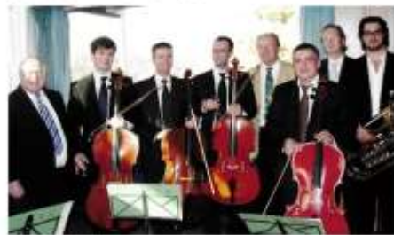
Essener Philharmoniker im ETB