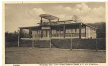
Clubhaus ETB Tennis 1930