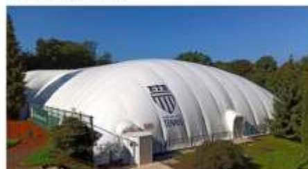
ETB Traglufthalle mit drei Allwetterplätzen für die Wintersaison ab 2022